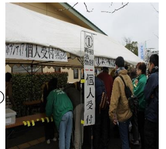
ボランティア受付の様子