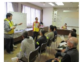
参加者が実際説明してコーディネーター