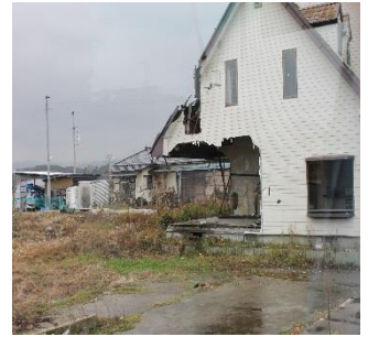
津波被害は甚大（相馬市）