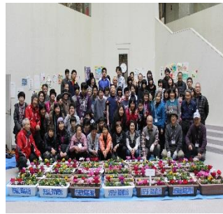
原町学園利用者の皆さんと