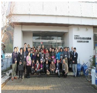
石巻市社会福祉協議会の前

最後に申込みいただいたにもかかわらず満席のために参加していただくことができなかった皆様、キャンセル待ちをしていただいた皆様には、心からのお詫びと事業へのご理解に対する御礼を申し上げます。