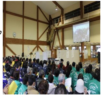
オリエンテーションビデオ 投影の様子