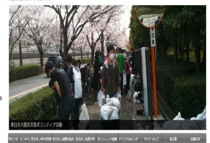
ホームページトップ画面

浦安市災害ボランティアセンター TEL: 047-355-5520 (9:30-17:00) 24時間受付 info@urayasusvc.jp